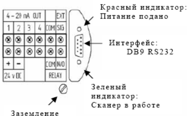
рисунок 3 Подключение