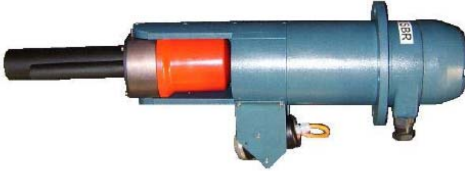
Изображение 1 Модель Сканера Ленточного конвейера LM2D

Сканер Ленточного конвейера измеряет объем материала, проходящего по ленточному конвейеру. Для этого используется бесконтактный лазер и радарная технология, чтобы определить профиль материала, находящегося на ленте, одновременно контролируя скорость движения ленты. Произведение площади поперечного сечения материала на скорость движения ленты дает расход материала по ленте в м. 3 /мин. Это значение выдается по первому каналу 4-20mA. Второй выход 4-20mA выдает скорость движения ленты в м./сек. Третий канал площадь поперечного сечения продукта. Третий канал может использоваться совместно с датчиком скорости движения ленты, для вычисления объема, если лазер заказывается без радара.